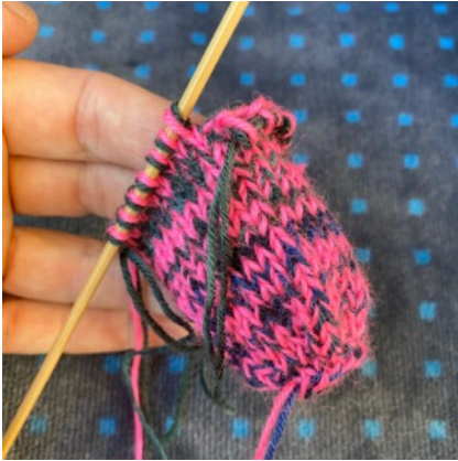
les 7 dernières mailles sur 1 aiguille