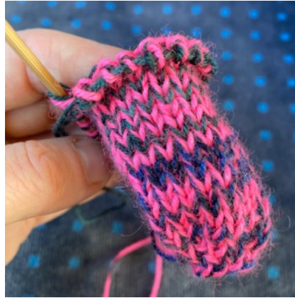
et les 17 autres sur un fil